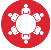
Kriz Masası ve Kamu İletişimi

Afet Platformu Kriz Masası komisyonu depremin hemen sonrasında yaptığı Acil Durum Toplantısı'nda ekipleri sahaya yönlendirmiştir. Platform üyelerinden bazılarının İzmir'de olması Valilik tarafından oluşturulan Kriz Masası'na dahil olmamızı, yerel yönetimler ve yerel STK'lar ile hızlıca iletişim kurmamızı, doğru ve güvenilir bilgilere ulaşmamızı sağlamıştır. Çalışmalarımız 5 ana başlıkta toplanarak sorumluları belirlenmiştir;