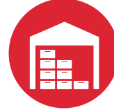
Lojistik ve Depo